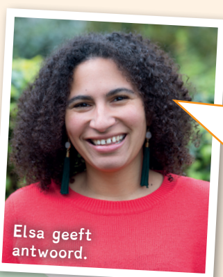
Elsa geeft antwoord.

ILLUSTRATIE: ALEX VAN KOTEN